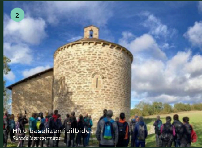
Hiru basilizen ibilbidea Ruta de las tres ermitas