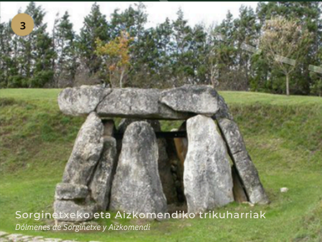
Sorginetzeko eta Aizkomendiko trikuharriak Dólmenes de Sorginetxe y Aizkomendi