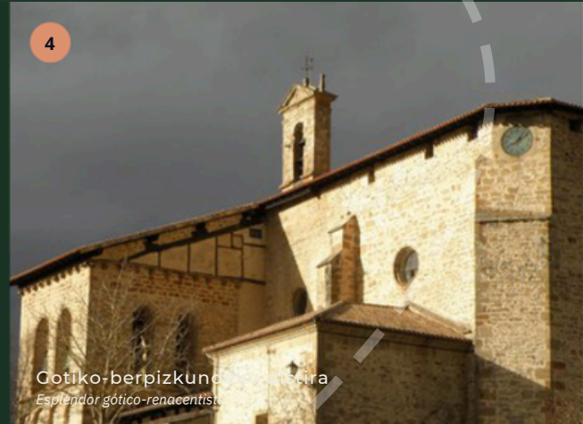
Cotiko-berpizkundeko harribitxiak Esplendor gótico-renacentista